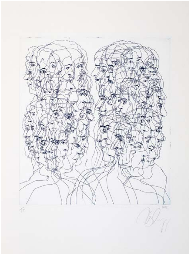
Größe 53,5 x 39,5, Preis 850 € Gerahmt: Größe 72,5 x 52,5, Preis 950 €